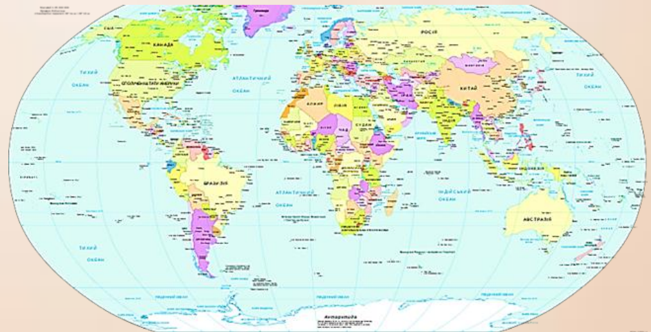
Політична мапа світу

Політична мапа світу з'явилася з утворенням перших держав.