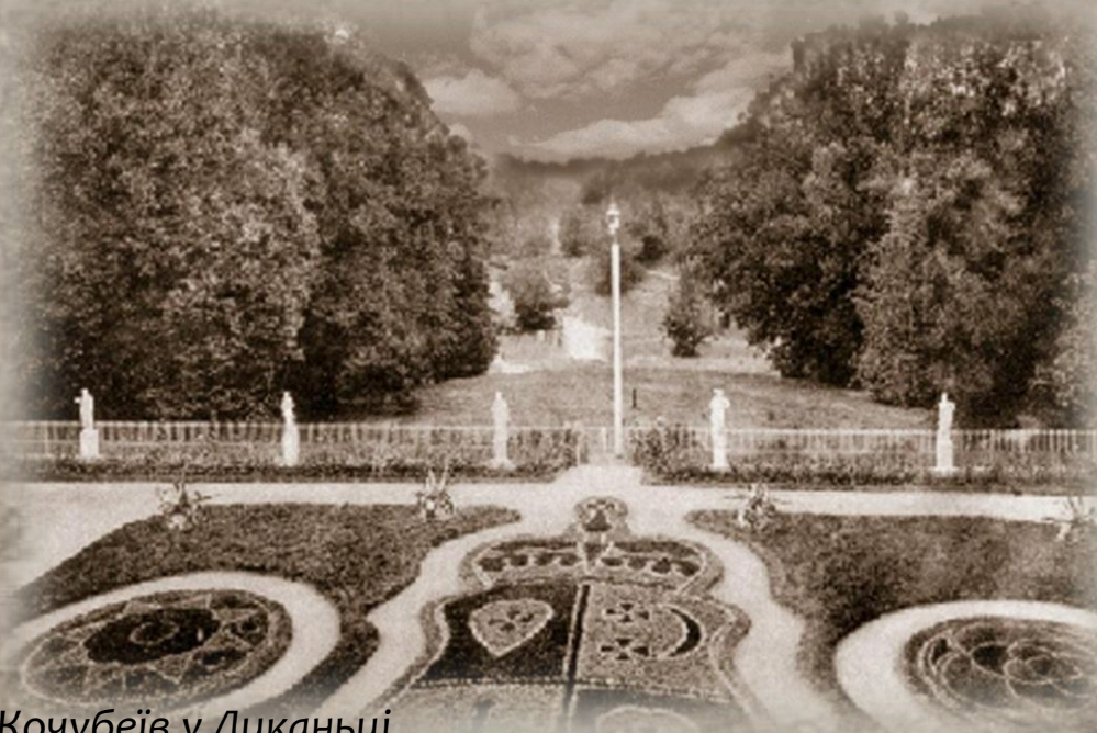
Маєток Кочубеїв у Диканьці

«За красою саду, парку, споруд Диканька може позмагатися з віллами Боргезе і Доріа в Римі! Дуже шкода, що в світі навіть не підозрюють про існування цього місця».