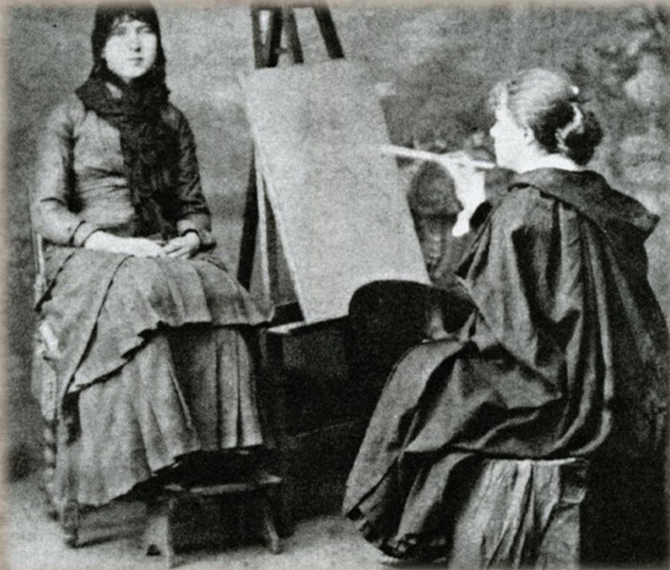
Марія Башкирцева за роботою.

Сама художниця у своєму щоденнику писала: «Радості від перемог немає, тому що це досягнуто тривалою та копіткою працею, в них немає нічого неочікуваного, я відчуваю себе на шляху до більш високого і досконалого, і створене вже не задовольняє».