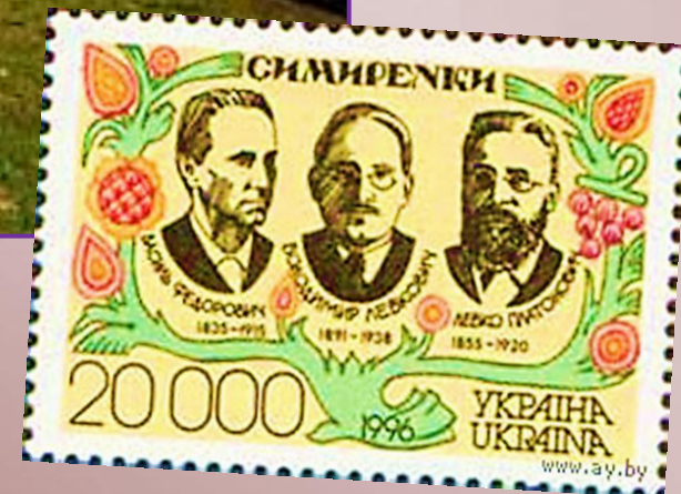
Левко Смиренко на поштовій марці 1996 року (праворуч)