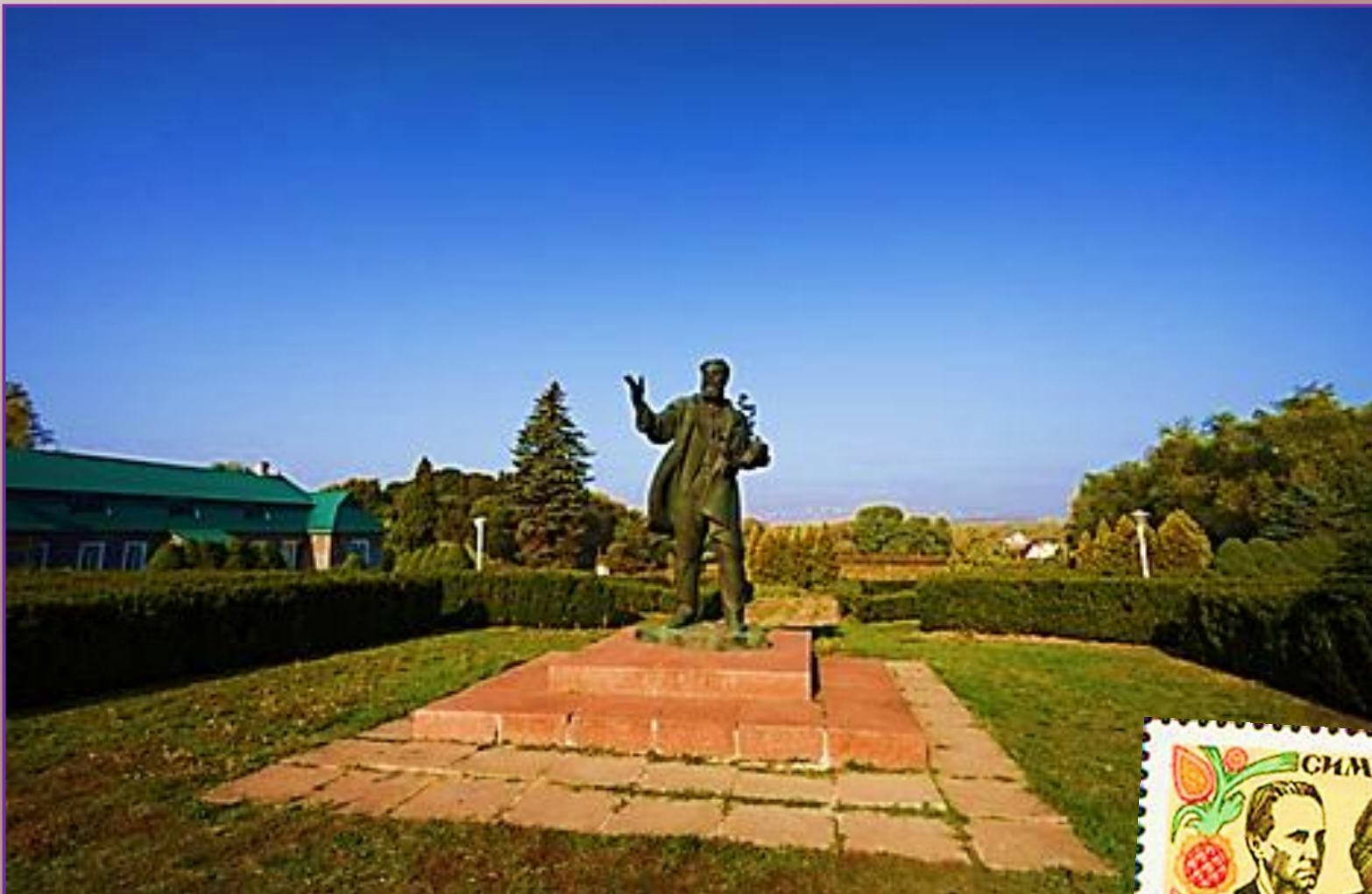
Пам'ятник Льву Смиренку в Мліві